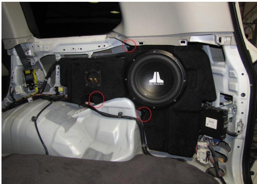
Рисунок – 4

7. Когда все точки совпали, затягиваем все болты.