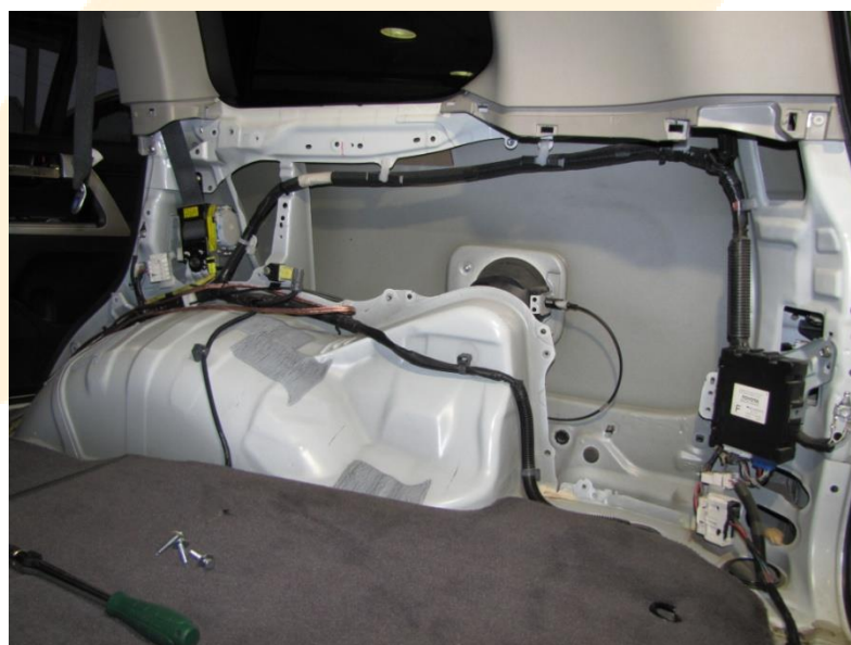
Рисунок – 1