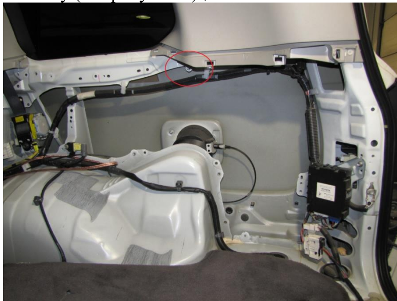
Рисунок - 2